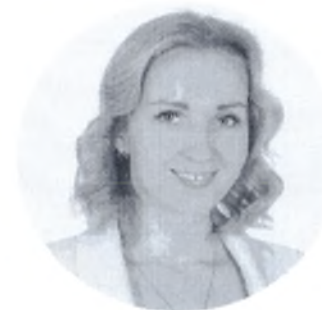
Львова-Белова Мария Алексеевна

Народная артистка России, член Комиссии при Президенте РФ по делам инвалидов, художественный руководитель Центра социальной интеграции Дианы Гурцкая