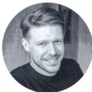
Ефремов Никита Михайлович

Актёр театра и кино, член попечительского совета Благотворительного фонда «БЭЛТА. Дети- бабочки»