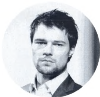
Козловский Данила Валерьевич

Уполномоченный при Президенте Российской Федерации по правам ребёнка