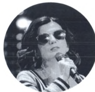
Гурцкая Диана Гудаевна

Председатель Всероссийского общества инвалидов, депутат Государственной Думы Федерального Собрания Российской Федерации