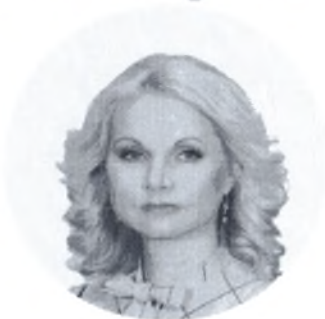
Голикова Татьяна Алексеевна

Заместитель Председателя Правительства Российской Федерации.